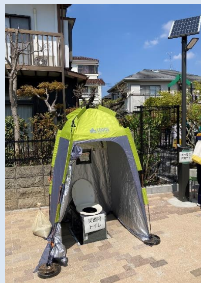
災害用トイレと太陽光で携帯充電も可能な街灯